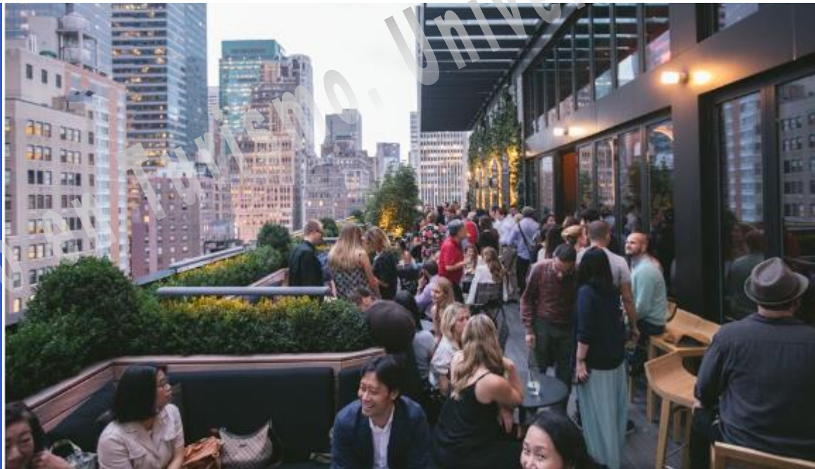
Cóctel de inauguración del AC Hotel New York Times Square.

El nuevo hotel de Nueva York está en Manhattan y tiene 4 estrellas. Con 290 habitaciones, el nuevo AC Hotel New York Times Square es de estilo urbano y hace gala de elementos clásicos que remiten a las raíces españolas de la cadena. La vinculación con el país de origen de AC también queda plasmada en la propuesta gastronómica .